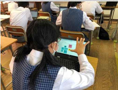
1) パソコン上に付箋紙を貼って、日本語で発表メモを作ります。

July 16 th , Friday Today's Goal: To be able to tell what you want to do in the future without looking at your memos (メモを見ないで将来やりたいことについて話すことができる。) Flow of the class(授業の流れ): 1. Time check 2. Practice / checking 3. Pair practice 4. Last time check