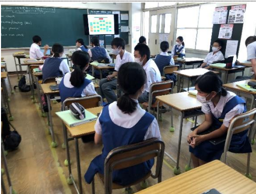
3) メモを見ないでスピーチ練習をしています。