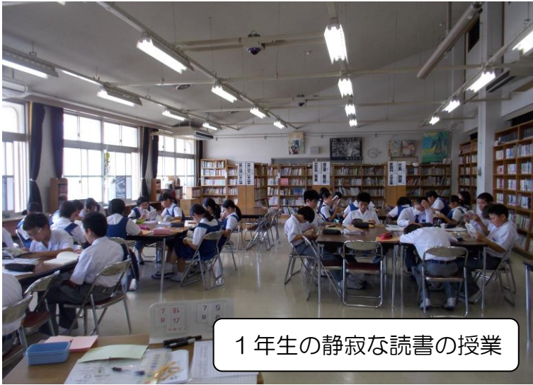
1年生の静寂な読書の授業