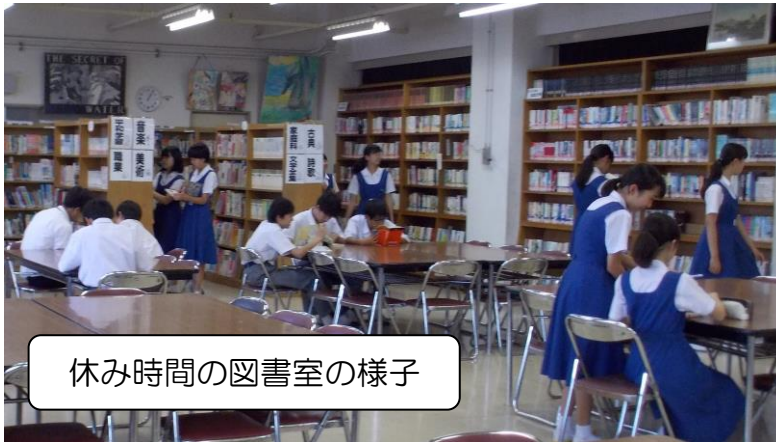
休み時間の図書室の様子

休み時間になると、たくさんの生徒が図書室に足を運びます。梅雨のため雨が続き、じめっとした気候ですが、図書室には本を手にとり、本に親しむ生徒が集まり、とてもさわやかな時間が流れています。多くの本を借りて読んでほしいなと私の気持ちも高ぶります。